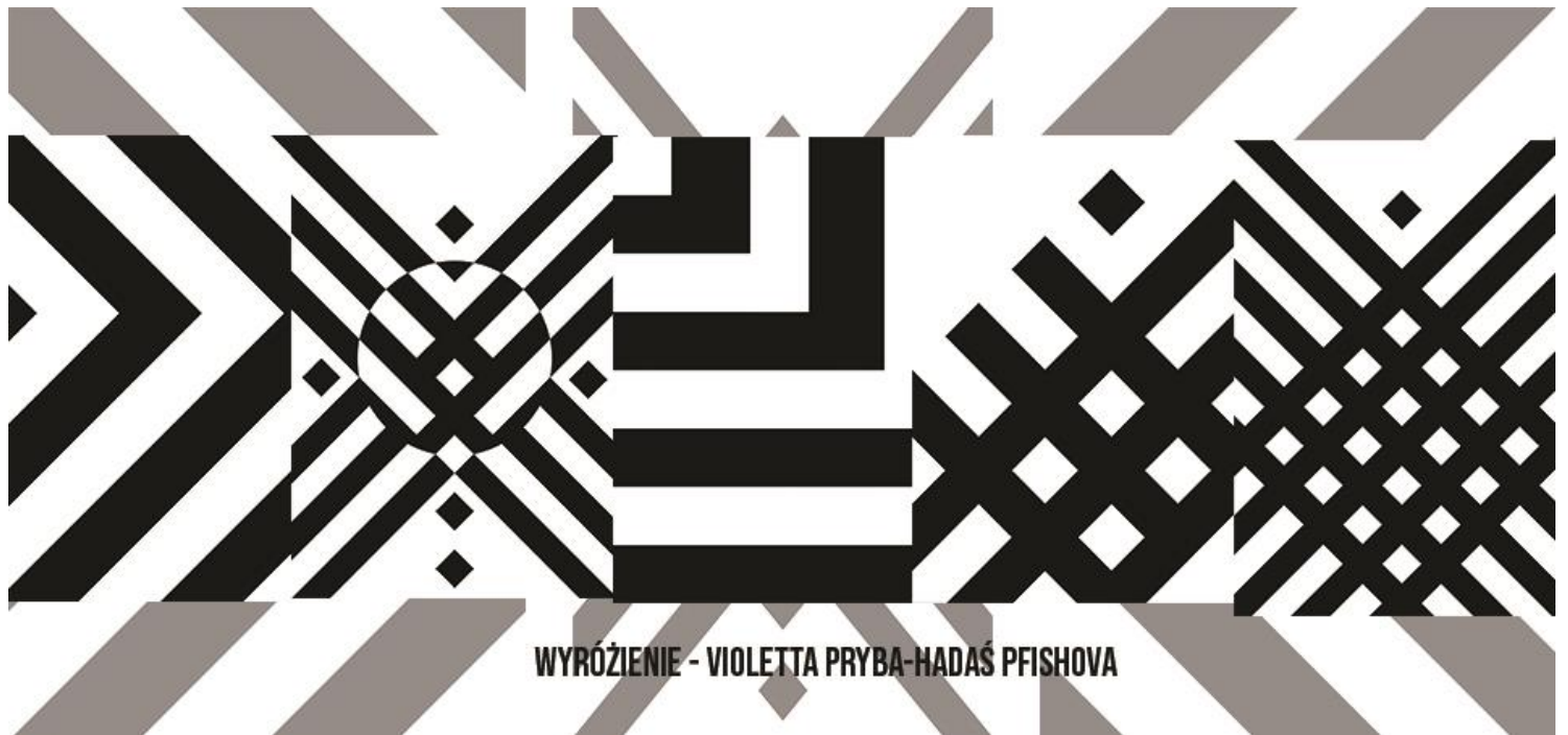
WYRÓŻENIE - VIOLETTA PRYBA-HADAŚ PFISHOVA