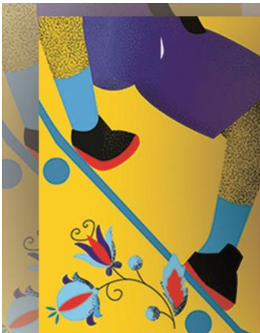
I MIEJSCE - AGATA STACHOWIAK