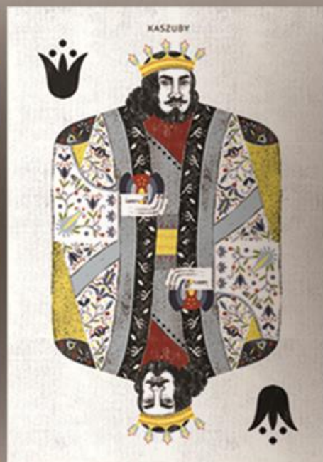
II MIEJSCE - SYLWIA LONKA